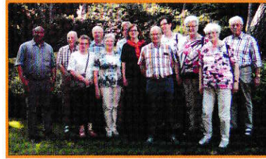
Besuch bei Harrison