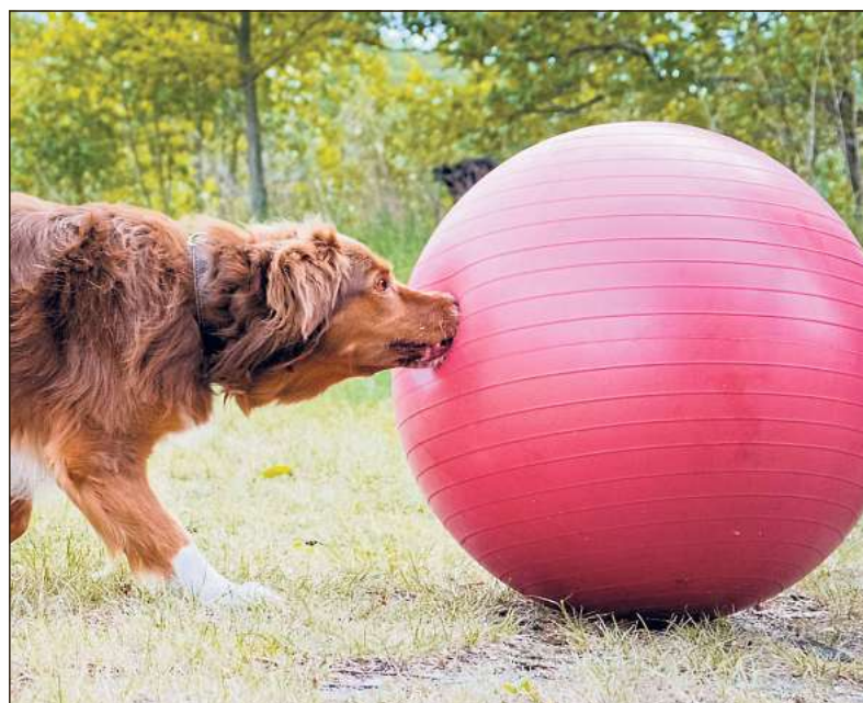
Beim Treibball geht es um viel Bewegung, Geschicklichkeit, klare Kommunikation und gutes Teamwork.

Weitere Informationen finden Interessierte im Internet auf www.sv-og-sassenberg.de .